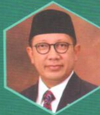
Lukman Hakim Saifuddin The Minister of Religious Affairs, RI